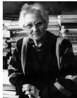
К 100-летию Франсуазы Дольто

«В своем сознании нам предстоит еще проделать огромный путь, для того чтобы понять, что раннее воспитание ребенка в обществе ему подобных является задачей номер один. То, что попадает под рубрику школы и образования, не рассматривается в настоящее время как нечто главное, как предмет первостепенной важности.