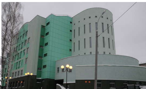
3 Корпус III ▲