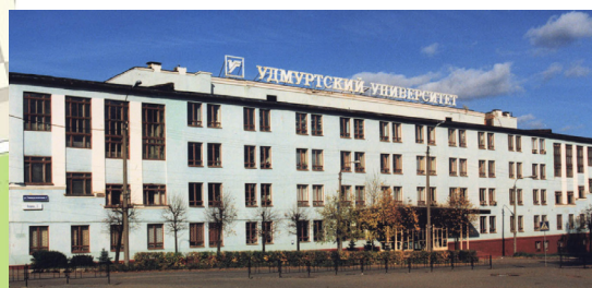
1 Корпус I ▲