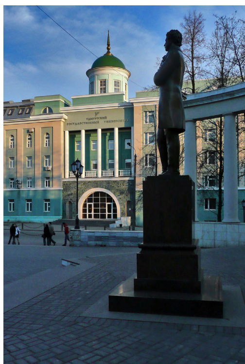
4 Университетская площадь ▲